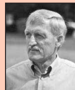
Het enige provincieraadslid in Tienen