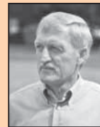
Het enige provincieraadslid in Tienen