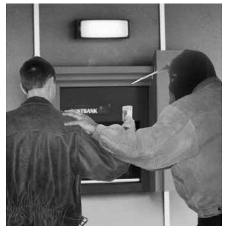
In een stad als Antwerpen worden liefst 68% van de gewapende diefstallen door vreemdelingen gepleegd.

Ondanks dit alles slaagde de onderzoeker er alsnog in haar rapport begin dit jaar aan haar opdrachtgever af te leveren. Men stond erbij, men keek er naar... én wilde blijkbaar absoluut vermijden dat deze studie in de openbaarheid zou komen. Daartoe werd dan ook een mistgordijn opgetrokken, in de ijdele hoop dat een en ander een stille dood zou sterven. Eerst heette het dat moest worden gewacht op een