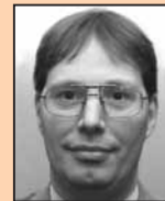
Hagen Goyvaerts Huttelaan 35 3001 Heverlee 016/40.81.26