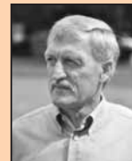
Het enige provincieraadslid in Tienen